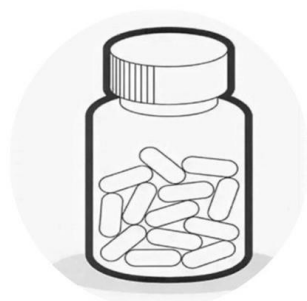
Изображение 1 ( ссылка для скачивания картинки в хорошем качестве)